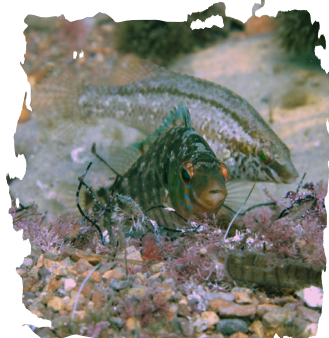
CRÉNILABRE CENDRÉ EN PÉRIODE DE REPRODUCTION

L'herbier édifie au cours du temps un enchevêtrement de rhizomes et de racines colmatés par des sédiments formant la « matre », contribuant ainsi à la stabilisation des fonds ainsi qu'à la protection des côtes et des plages contre l'érosion.