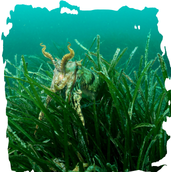
SÈCHE DANS HERBIER DE POSIDONIE