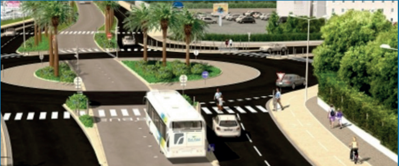
Création d'un bus à haut niveau de service de Grasse et Mouans-Sartoux