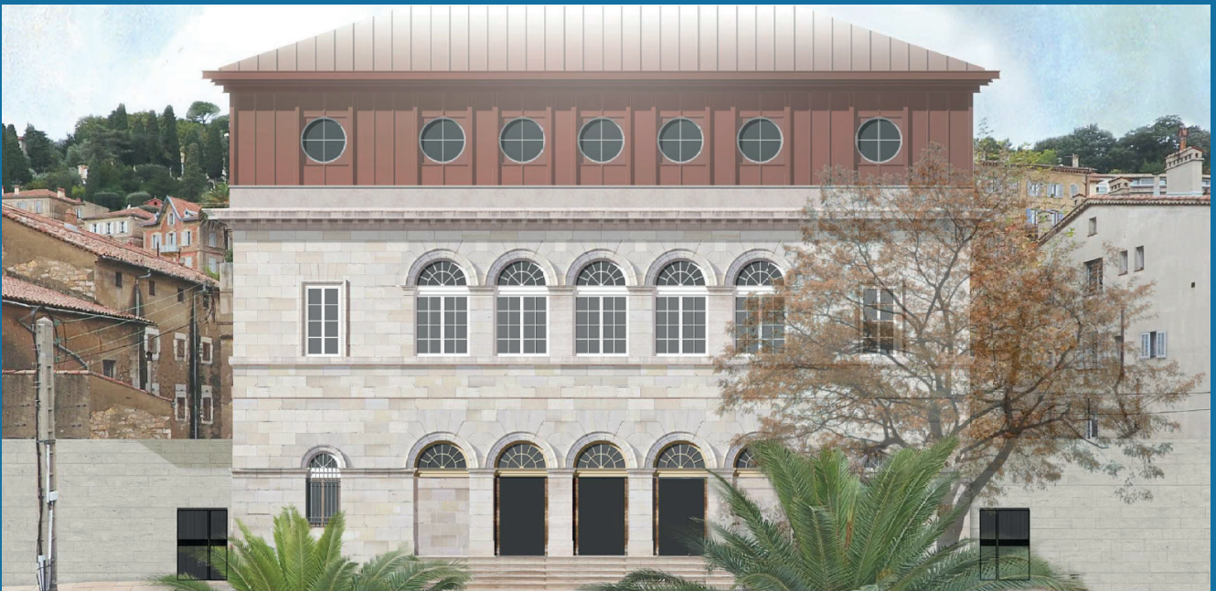
Création d'un campus « vert » à Grasse